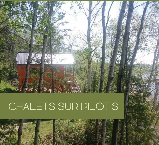
CHALET SUR PILOTIS