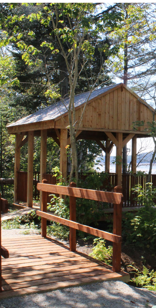
Belvédère de la boucle du village