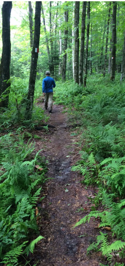
Sentier Neil-Tillotson — Sylvie Harvey