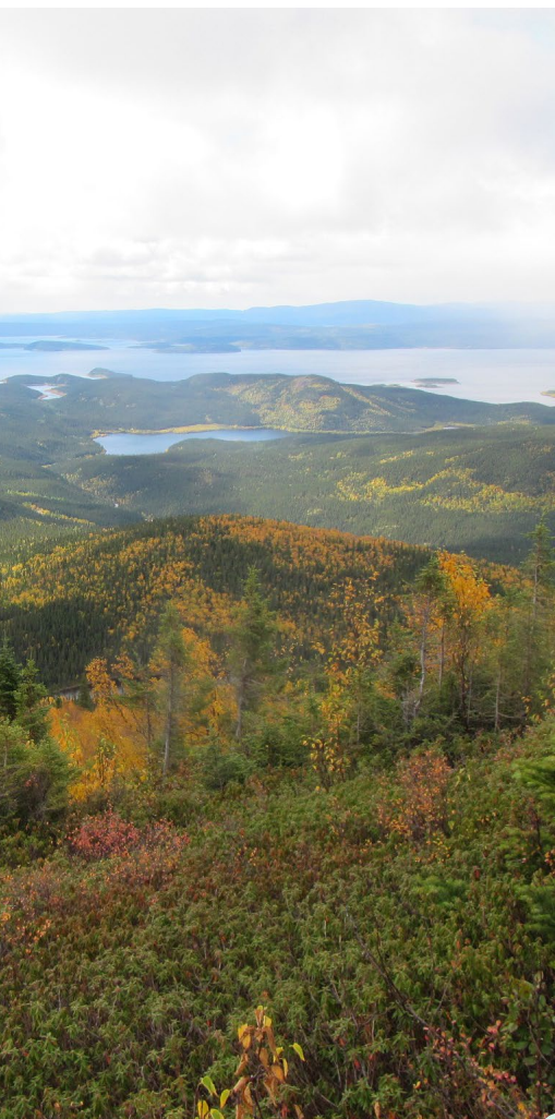
Point de vue au sommet