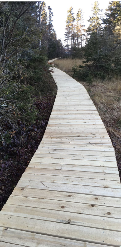
Trottoir de bois sur le sentier L'aventurier