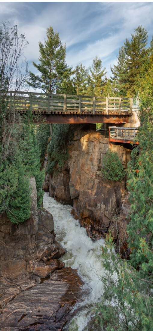
Chute des Dalles — Fabien Proulx-Tremblay

Parc régional des chutes Monte-à-Peine-et-des-Dalles administration@parcdeschutes.com 450 883-6060 parcdeschutes.com