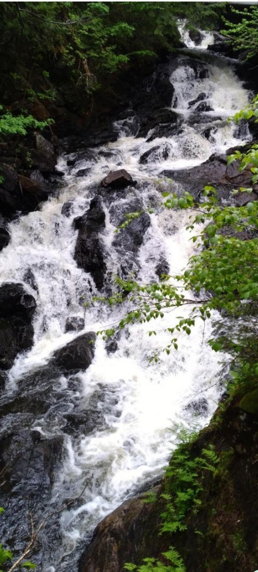
Pont sur le sentier Iroquois