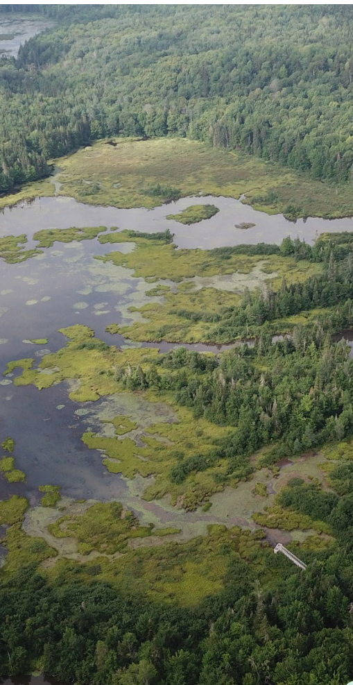
Vue aérienne des Marais du Nord