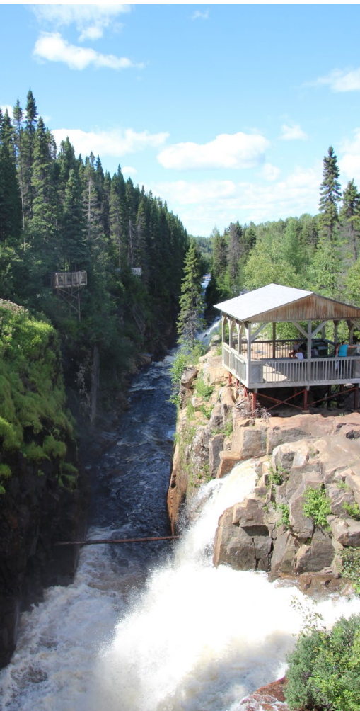
Canyon de la Rivière-à-Mars