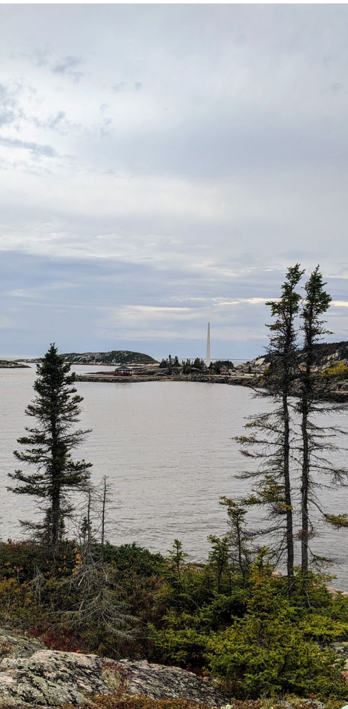
Point de vue sur le fleuve